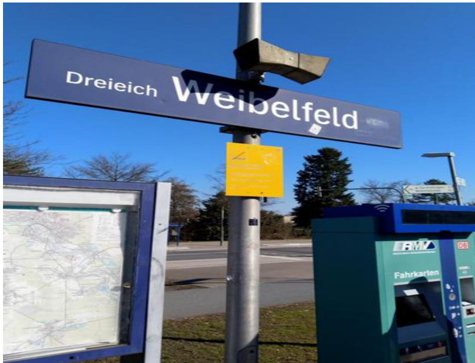
-Die Haltestelle Dreieichenhain-Weibelfeld