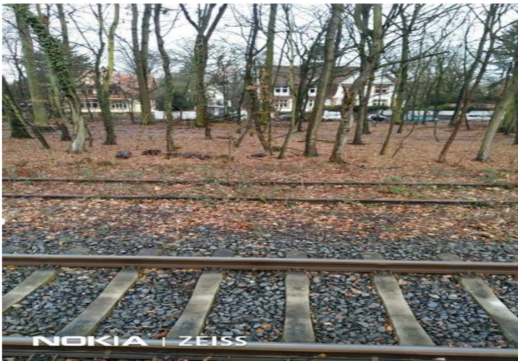
Deswegen protestieren die Anwohner und schlagen Langen als Endhaltestelle vor. Langen und Kreis OF stimmen dem zwar zu, jedoch ist dies außerhalb des RTW-Projekts.