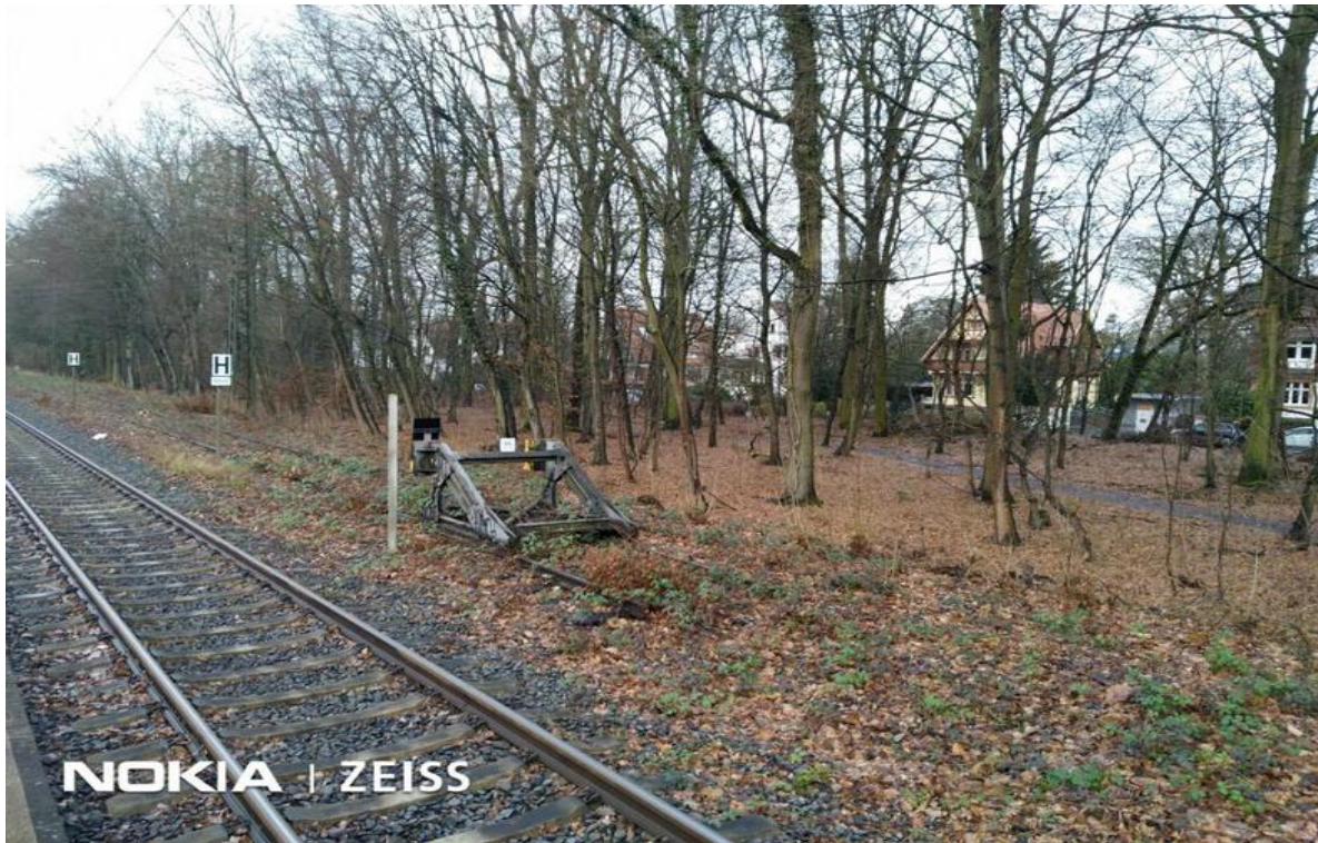
Das Gleis der Dreieichbahn, Richtung Frankfurt, , die alten Jugendstilvillen sind ganz nah dran