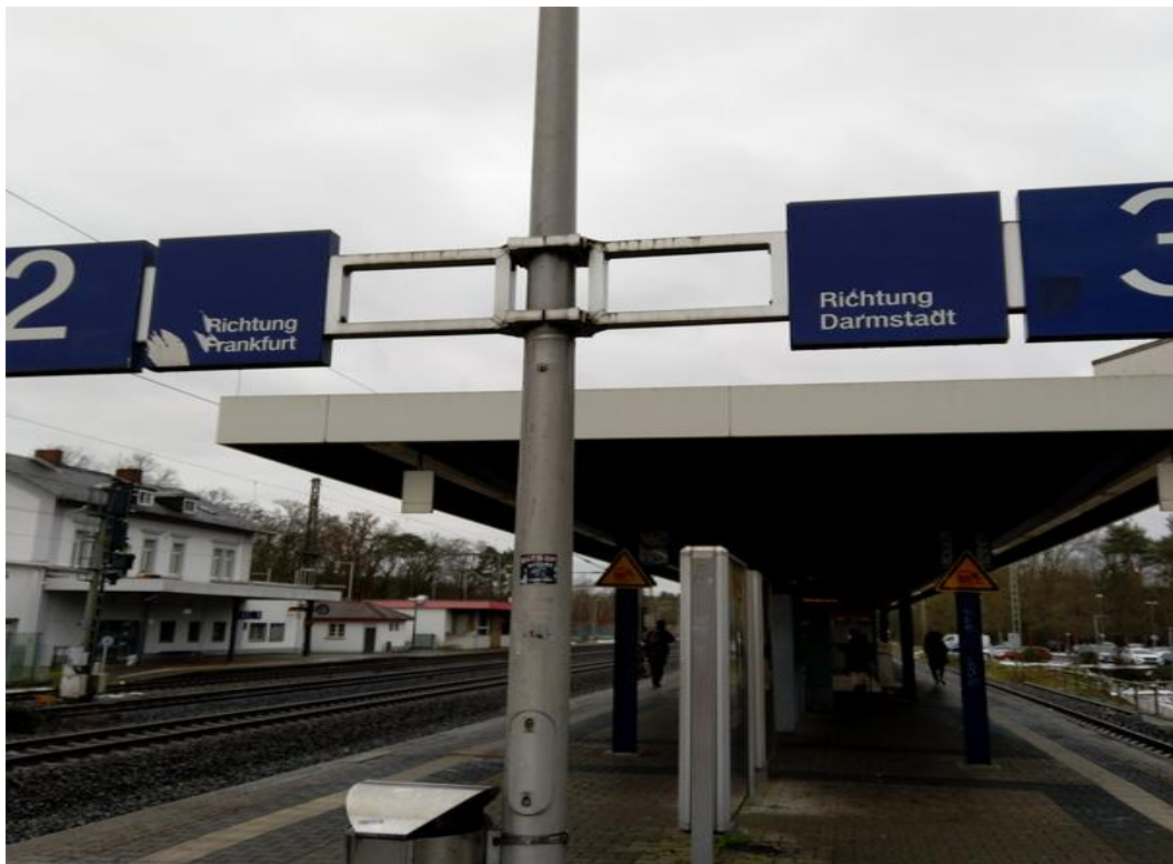
Links das stillgelegte Gleis Richtung Innenstadt sowie der KGV Fischer-Lucius.