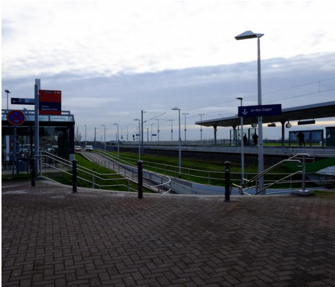
Kreis Offenbach, Hainhausen, SI