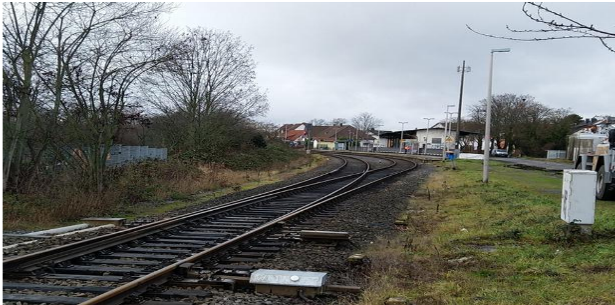
Foto: Dreieich-Sprendlingen, Fahrtrichtung Buchschlag/Neu-Isenburg/Frankfurt

Zur Erinnerung: Eppertshausen und Urberach sind Haltestellen der Dreieichbahn. In Urberach soll die S2 eintreffen, in Eppertshausen ein zweites Gleis installiert werden, damit die RB61 halbstündlich fahren kann.