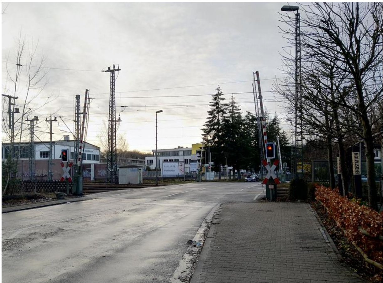
Bahnübergang Richtung Neu-Isenburg-Zeppelinheim, Cargo City Süd und Flughafen (10 Km)