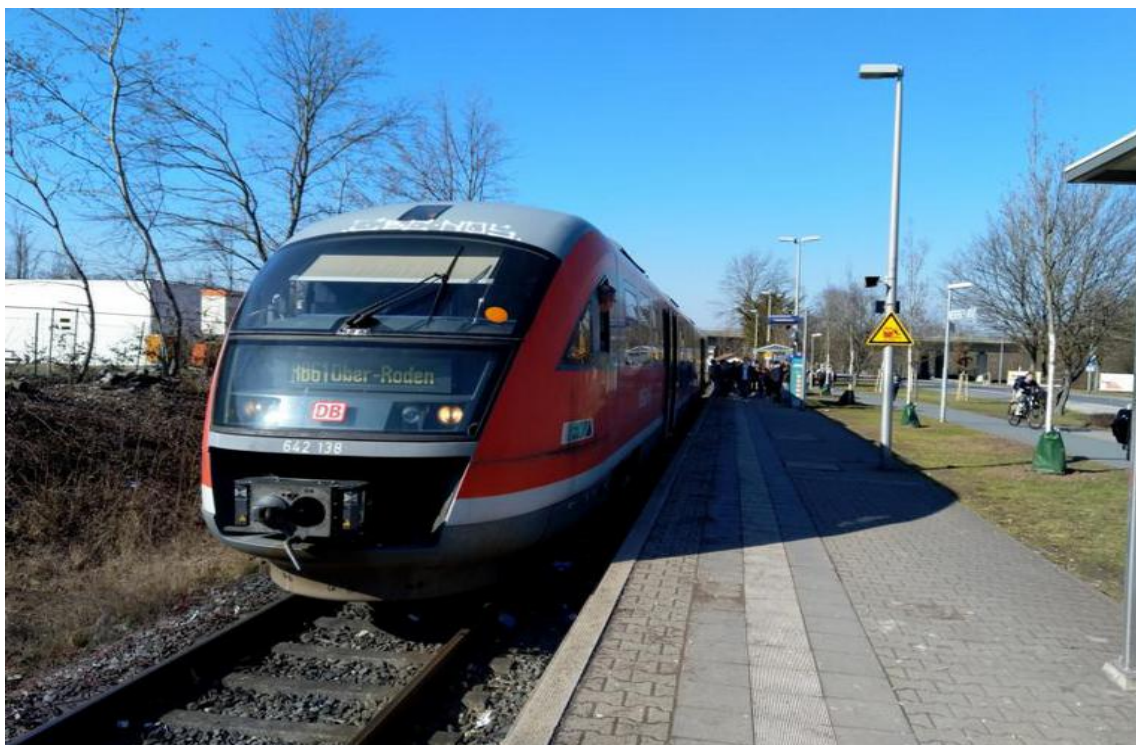
Hier ist noch einer der alten Züge unterwegs. Um 13:03 steigen meistens Schüler ein.