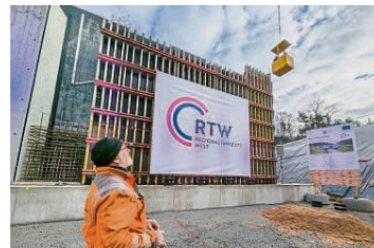
Im Käfig hat man eine gute Übersicht über die Baustelle.