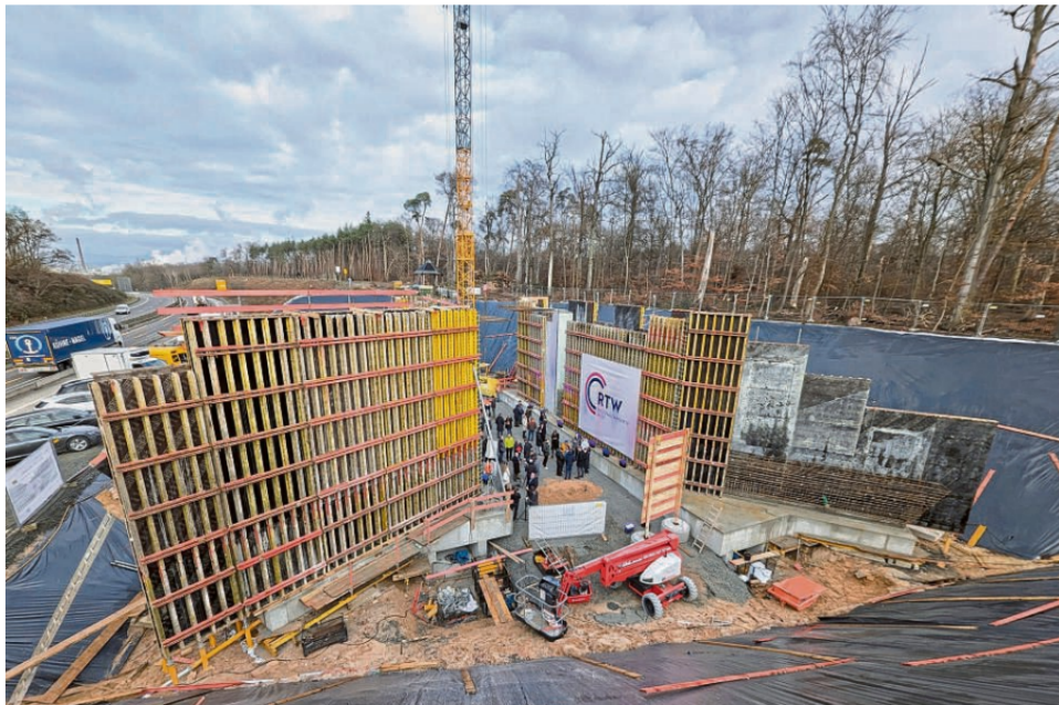
Blick über die Baustelle an der B40 nahe Kelsterbach. Hier fährt die RTW auf einer Brücke unter den Bahngleisen hinweg.

Ende 2028 sollen die ersten Züge fahren / Nahverkehr am Limit Von Florian Leclerc (Text)