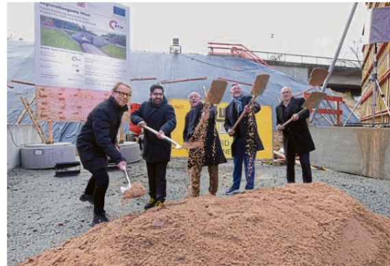
Nun fliegt der Sand, auch wenn die Brücke schon halb gebaut ist.

Die Regionaltangente könnte zu einer wichtigen Alternative werden. Die Besucher:innen aus dem Westen Frankfurts, aber auch aus Eschborn und dem Hochtaunuskreis würden sich den Umweg über den Frankfurter Hauptbahnhof vermutlich künftig sparen. Sie gelangen mit der RTW zum Bahnhof Höchst, der für den Westen Frankfurts eine zentrale Bedeutung fürs Umsteigen hat. Auch in Eschborn und in Bad Homburg halten die Bahnen. Für die S-Bahn-Linien, die vom Stadion in die Frankfurter Innenstadt fahren, könnte das die dringend benötigte Entlastung bringen.